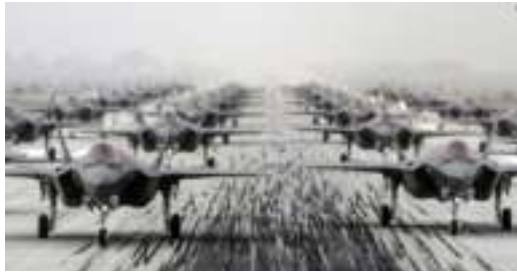
Ilustración 8: del artículo

Los aviones de combate furtivos F-35 de primera línea de Estados Unidos y Corea del Sur se unen, por primera vez, en un ejercicio de 10 días, destinado a enviar un mensaje a Corea del Norte. Seis F-35A de la Fuerza Aérea de Estados Unidos, de la Base de la Fuerza Aérea Eielson, en Alaska, llegaron a Corea del Sur y volarán con F-35 de la nación anfitriona, en una serie de ejercicios que finalizarán el 14 de julio. El objetivo es mejorar la interoperabilidad sus fuerzas aéreas, al tiempo que demuestra la fuerte disuasión y la postura de defensa conjunta de la alianza de ambas naciones.