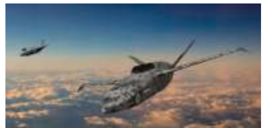
Ilustración 7: "Numeral no tripulado" de LANCA que opera con un RAF F-35B

El Proyecto Mosquito, el demostrador de tecnología para el programa de aeronaves de combate novedosas ligeras y asequibles (LANCA), se lanzó en 2015 para, finalmente, desplegar un "numeral no tripulado" ( wingman ), que podría operar junto con los cazas actuales, como el Typhoon y el F-35B y, posteriormente, formar parte del Sistema Aéreo de Combate del Futuro. Tres oferentes presentaron propuestas para desarrollar y construir el demostrador de tecnología Mosquito; un equipo de Spirit AeroSystems (anteriormente Bombardier Belfast), Callen-Lenz y Northrop Grumman UK recibió un contrato de tres años y 30 millones de libras esterlinas para este trabajo. El vehículo aéreo Mosquito debía volar a fines de 2023.