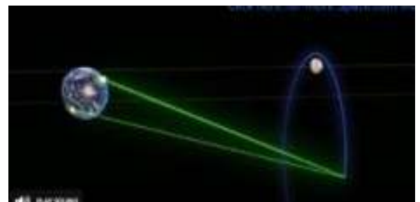
Ilustración 10: imagen de la misión extraído de un video del artículo

https://www.space.com/nasa-capstone-cubesat-moon-launch-success-rocket-lab?utm_campaign=58E4DE65-C57F-4CD3-9A5A-609994E2C5A9