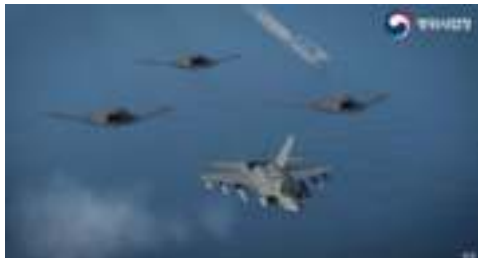
Ilustración 9: El KF-21 en una imagen artística con capacidades de sexta generación

Desarrollado a partir del programa KF-X, el Boramae (Hawk, en coreano) es el avión más avanzado jamás desarrollado en Corea del Sur. El avión supersónico reemplazará a los viejos aviones de combate F-4 Phantom y F-5 Tiger II de la Fuerza Aérea de Corea del Sur, que han estado utilizando estos aviones desde la década de 1970. A pesar de las formas sigilosas que hacen referencia al F-22 Raptor, el KF-21 está clasificado como un avión de combate de generación 4.5, es decir, menos avanzado que el avión Lockheed Martin, aunque la apuesta es llevarlo a esquemas de sexta generación, como se muestra en la imagen.