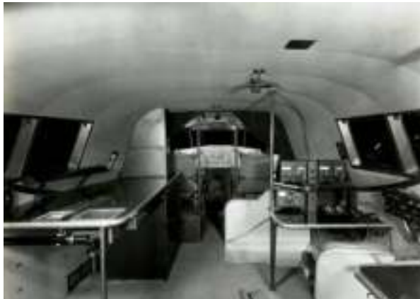
Ilustración 11: Flight Deck de un Boeing 314

¿CÓMO SE CONFORMARON LAS TRIPULACIONES DE DOS PILOTOS EN LOS AVIONES DE TRANSPORTE?