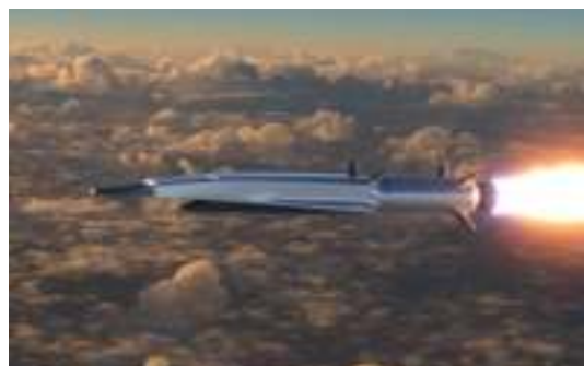
Ilustración 4: del artículo

Un grupo de investigadores chinos acaba de presentar una nueva tecnología de inteligencia artificial que, según dicen, es capaz de predecir la trayectoria de los misiles hipersónicos en tan solo 15 segundos. Si este sistema se llega a hacer realidad, será capaz en teoría de detener hasta a los planeadores hipersónicos contra los que no hay defensa todavía.