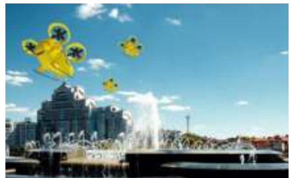
Ilustración 1: del artículo

La Agencia Europea de Seguridad Aérea (EASA) hizo historia al convertirse en la primera autoridad reguladora a nivel mundial en publicar un reglamento para la operación de taxis aéreos en el entorno urbano, que estará abierto a consulta pública hasta el 30 de septiembre de 2022. La Agencia de Seguridad Aérea de la Unión Europea propone el establecimiento de un marco regulatorio integral para abordar nuevos conceptos operativos y de movilidad, que se basan en tecnologías innovadoras como los sistemas de aeronaves no tripuladas (UAS) y aeronaves con capacidad de despegue y aterrizaje vertical (VTOL) y fomentar y promover su aceptación y adopción por parte de los ciudadanos europeos.