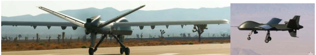
Ilustración 4: fotos de la galería de General Atomics Aeronautical Systems

General Atomics Aeronautical Systems (GA-ASI) presenta un nuevo sistema de aeronaves no tripuladas llamado Mojave, que recibe su nombre de una de las zonas más duras y austeras del mundo, donde las mortíferas serpientes de cascabel y los lagartos con cuernos se adaptan para sobrevivir a las fuerzas extremas de la naturaleza. El Mojave se basa en la aviónica y los sistemas de control de vuelo del MQ-9 Reaper y el MQ-1C Gray Eagle-ER, pero se centra en las capacidades de despegue y aterrizaje cortos (STOL) y en una mayor potencia de fuego. Cuenta con alas ampliadas con dispositivos de gran elevación y con un motor turbohélice de 450 CV. El Mojave ofrece opciones para operaciones de avanzada sin necesidad de pistas o de infraestructuras aeroportuarias típicas. Puede aterrizar y despegar desde superficies no mejoradas, al tiempo que conserva importantes ventajas en cuanto a resistencia y persistencia respecto a los aviones tripulados. Estas innovaciones hacen del Mojave el UAS perfecto para realizar misiones de vigilancia, ataque y reconocimiento armado.