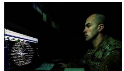
Ilustración 5: imagen del artículo

Más que cualquier otra amenaza, los ciberataques constituyen la mayor preocupación para la seguridad nacional de Estados Unidos, según los resultados de la primera encuesta sobre el espacio de defensa de Breaking. La encuesta en línea, que se llevó a cabo desde mediados de agosto hasta mediados de septiembre del corriente, entrevistó a casi 500 profesionales espaciales sobre una variedad de temas, incluyendo las mayores amenazas a las ambiciones espaciales de Estados Unidos, el papel cada vez más importante de la Fuerza Espacial y cuáles son las capacidades espaciales que más se necesitan como inversión a futuro.