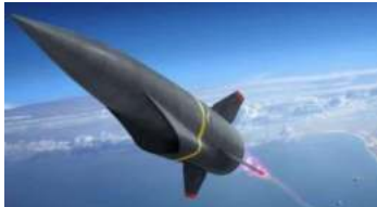
Ilustración 3: imagen de un arma supersónica

El Financial Times ha revelado que China realizó una segunda prueba, tres semanas después del primer lanzamiento del misil hipersónico el pasado mes de julio, en la que se disparó un proyectil mientras el vehículo deslizante alcanzaba velocidades hipersónicas. Expertos en defensa y funcionarios militares del Pentágono expresaron su sorpresa ante el desarrollo tecnológico de China, que logró poner en órbita este proyectil que desafía las leyes de la física, avance que ningún otro país ha logrado hasta el momento. Sencillamente, este misil se hizo realidad y se convirtió en una verdadera amenaza.