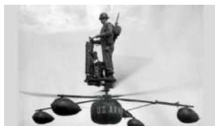
Ilustración 6: imagen del artículo

Esta es una temática que parece actual o, por lo menos, de hace solo un par de años. No obstante, la instantánea se tomó hacia mediados del siglo pasado y lo que muestra no es un vehículo diseñado para la logística o el transporte de pasajeros, sino el HZ-1 Aerocycle como uno de los dispositivos más prometedores del ejército estadounidense para misiones de reconocimiento.