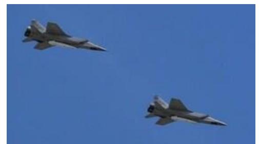
Ilustración 1: dos cazas rusos MiG-31, equipados con misiles hipersónicos Kinjal, sobrevuelan la plaza Roja de Moscú, el 9 de mayo de 2018, con motivo del desfile por el aniversario de la victoria en la II Guerra Mundial

https://www.swissinfo.ch/spa/rusia---un-paso-por-delante--en-misiles-hipers%C3%B3nicos/46809202