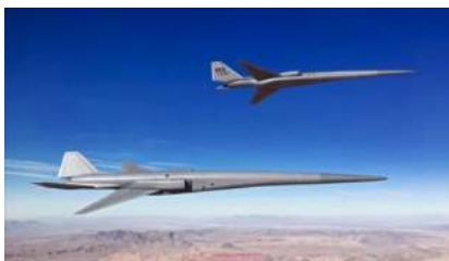
Ilustración 2: imagen conceptual de Exosonic de un dron supersónico

La empresa de transporte supersónico Exosonic anunció su asociación con la empresa de transformación de carbono Twelve, para desarrollar combustible de aviación sintético sostenible para sus motores a reacción supersónicos. La Fuerza Aérea de Estados Unidos (USAF) otorgó a Exosonic un contrato para la demostración en drones supersónicos. Este desarrollo de drones permitiría diseñar y fabricar aviones supersónicos de boom silencioso ( Boom Supersonic ). En paralelo, Twelve avanza en la producción de combustible para aviones a partir de CO 2 , utilizando tecnología patentada bajo un programa piloto de la USAF, que allana el camino para una mayor producción de combustible.