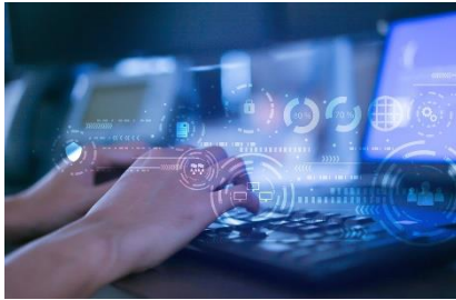
Ilustración 3: foto de la nota

El Ejército y la Fuerza Aérea de Estados Unidos están ajustando la forma en que administran los datos que crean, para asegurarse de recopilar la información más importante para futuras batallas. El problema es que hay muchos datos. En la Conferencia C4ISRNET (Red de Comando, Control, Computación, Comunicaciones, Inteligencia, Vigilancia y Reconocimiento), los principales estrategias de datos enfatizaron la importancia de romper los silos, para que los componentes tengan acceso a datos "autorizados" que puedan proporcionar información sólida para futuras guerras, bajo el concepto de una fuerza conectada del Departamento de Defensa, en todos los dominios.