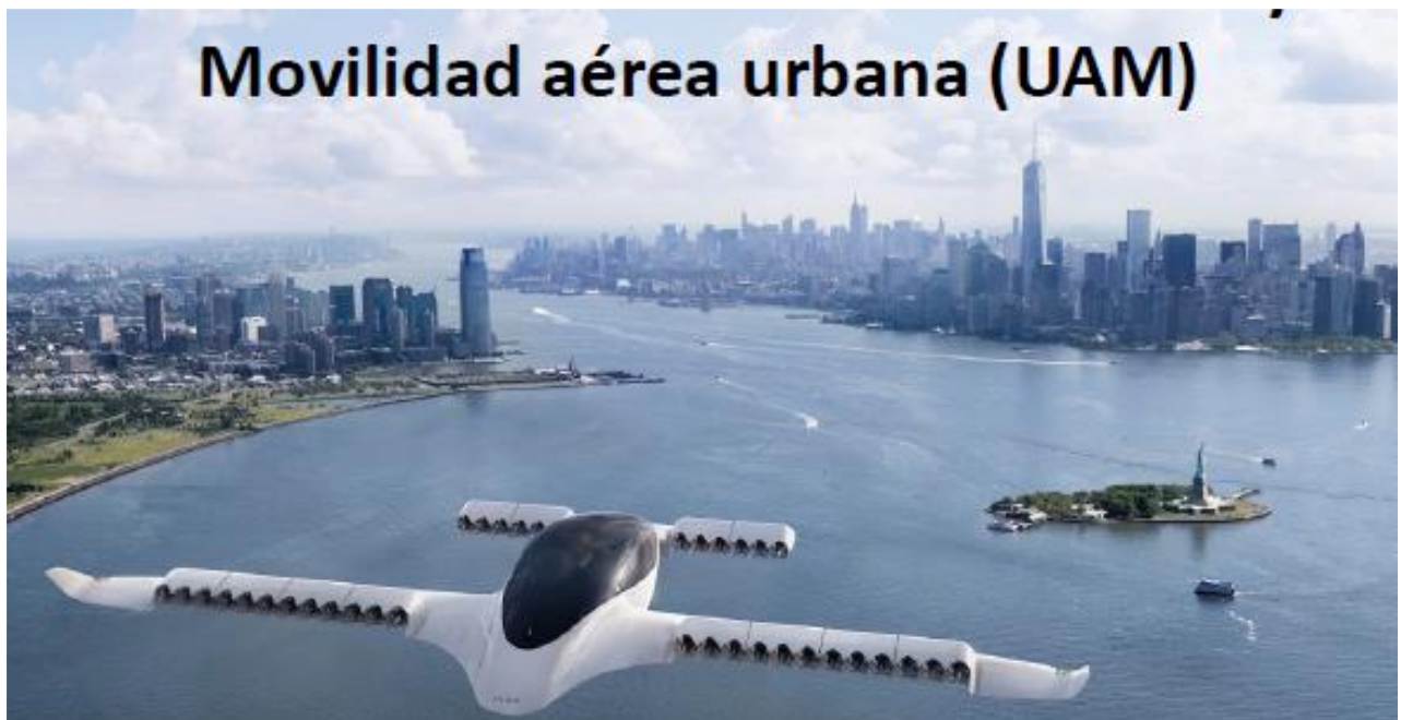
Ilustración 4: la empresa alemana Lilium se suma al proyecto de taxi aéreo dentro del concepto de "movilidad aérea urbana" iniciado por Boeing, Bell y Airbus

El concepto de movilidad aérea urbana ha cobrado mayor relevancia desde la última Asamblea de la OACI. El transporte inteligente y sostenible de mercancías y personas está siendo objeto de estudio e investigación desde hace años. Numerosos proyectos ven, en la movilidad aérea urbana, una solución factible y cada vez más tangible a los problemas actuales de congestión de tráfico. Lo que hace tiempo eran iniciativas ambiciosas y cercanas a la ciencia ficción se están convirtiendo, hoy día, en desarrollos tecnológicos que avanzan hacia drones altamente autónomos e integrados al espacio aéreo.