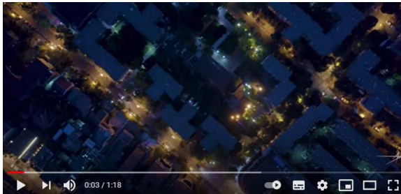
Ilustración 2: https://www.youtube.com/watch?v=afE7aPT5IWw Video conceptual de LM acerca del NGI

El Departamento de Defensa de los Estados Unidos ha adjudicado contratos a Northrop Grumman Systems Corp. y a Lockheed Martin Corp. en apoyo del programa Next Generation Interceptor (NGI). Con un valor máximo estimado de $1.6 mil millones hasta el año fiscal 2022, esta adjudicación de contrato está estructurada para llevar dos diseños a la fase de desarrollo de tecnología y reducción de riesgos del programa de adquisición, para reducir el riesgo técnico y de programación. Este premio garantizará que NGI sea parte eficaz y eficiente en la solución integrada del Sistema de Defensa contra Misiles (en inglés, MDS). Este concepto aumenta la competencia, al financiar dos diseños y continuar de manera flexible la alineación con las estrategias y prioridades en evolución.