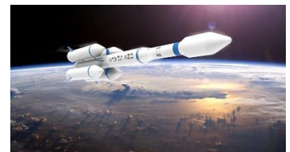
Ilustración 7: cohete de la serie OS-M de China.

La comunidad de inteligencia de los Estados Unidos enumeró en un informe el programa espacial de China, como una de las principales preocupaciones de seguridad de Estados Unidos. Algunos expertos y analistas espaciales criticaron el informe por pintar el programa espacial de China con un pincel amplio y por no establecer distinciones entre actividades espaciales civiles y militares. El Director del proyecto de seguridad espacial en el Centro de Estudios Estratégicos e Internacionales dijo: "Combina las capacidades espaciales, en general, con las capacidades espaciales que son amenazas potenciales".