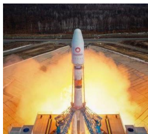
Ilustración 8: de la nota

Roscosmos lanzó desde el cosmódromo ruso de Vostochny el cohete Soyuz-2.1b con la etapa superior Fregat y 36 satélites de la compañía OneWeb a bordo. Según la información de telemetría, el inicio y la separación de la etapa superior del lanzador tuvo lugar de manera normal. Luego de la separación exitosa de la ojiva, la etapa superior de Fregat continuó lanzando 36 nuevos satélites a la órbita prevista. Durante las horas siguientes, los satélites OneWeb, de acuerdo con la secuencia de vuelo, se separaron secuencialmente, en grupos de cuatro satélites.