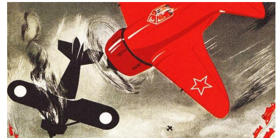
Ilustración 9: de la nota original

Realizar una embestida con el avión pilotado durante un combate aéreo exigía mucho coraje. Los pilotos rusos y soviéticos fueron los primeros en probar todo tipo de formas de hacerlo y la mayoría de ellos perdieron sus vidas en el intento. El capitán Piotr Nésterov fue el primer piloto ruso, así como la primera persona en el mundo, en llevar a cabo un ataque de ariete aéreo en combate, durante la Primera Guerra Mundial, el 26 de agosto de 1914, cuando un avión austríaco sobrevoló un aeródromo ruso en Galitzia con la intención de bombardearlo. Nésterov reaccionó inmediatamente, despegó en su ligero monoplano y se dirigió hacia el enemigo.