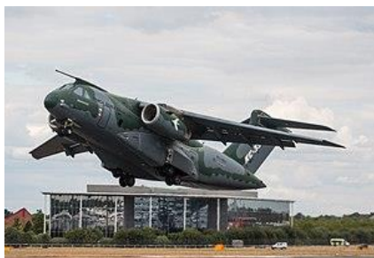
Ilustración 12: KC 390 en Farmborough

Los aviones militares de transporte son la primera herramienta para asistir catástrofes naturales o antrópicas. La participación de estas aeronaves en operaciones de ayuda humanitaria se ha convertido en un estándar de los escenarios de crisis. Su alcance y capacidad de carga, así como las facilidades para el sostén logístico al momento de su carga y descarga, las han convertido en un elemento de valor, no solo para las fuerzas aéreas, sino para la política de los Estados y para la Defensa.