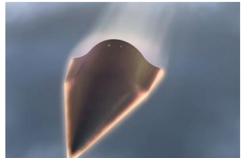
Ilustración 7: Kris Osborn, Fuerza Aérea de EE.UU.

La Agencia de Defensa de Misiles, del Departamento de Defensa de los Estados Unidos, anunció el 14 de enero que otorgó a L3Harris Technologies un contrato de $121 millones para construir un prototipo de satélite capaz de rastrear armas hipersónicas. Según el contrato, L3Harris tiene la tarea de construir un prototipo de demostración en órbita para el sensor espacial hipersónico y balístico de seguimiento de la Agencia, una constelación que se desplegará en la órbita terrestre baja, que es capaz de detectar y rastrear armas hipersónicas.