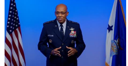
Ilustración 3: extraída de la nota

En su primer mes como jefe de Estado Mayor de la Fuerza Aérea, el General Charles Q. Brown Jr. ha advertido que esta necesita revisar su inventario y acelerar el ritmo de la guerra, o corre el riesgo de quedarse atrás de otras potencias globales. Para lograr este objetivo, el equipo de políticas de operaciones de la Fuerza está pensando en nuevas formas de incorporar, capacitar y emplear aviadores para operaciones globales.