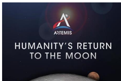
Ilustración 14: https://www.muycomputer.com/2020/09/22/regreso-a-la-luna-nasa-artemis/

La NASA llevó a cabo el encendido en la etapa central del cohete Space Launch System (SLS) que lanzará la misión Artemis a la Luna. La prueba en caliente es la prueba final de la serie Green Run. El plan de prueba requería que los cuatro motores RS-25 del cohete se dispararan durante un poco más de ocho minutos, la misma cantidad de tiempo que tomará enviar el cohete al espacio después del lanzamiento. El equipo completó con éxito la cuenta regresiva y encendió los motores, pero estos se apagaron después del primer minuto. Se están evaluando los