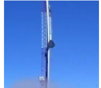
Ilustración 13: https://www.facebook.com/DefensaNAC/videos/lia-aerospace-realiz%C3%B3-su-primer-lanzamiento-trat%C3%B3-del-primer-lanzamiento-en-la/2877388065879787/

https://www.youtube.com/watch?v=byaPrfdaHLA