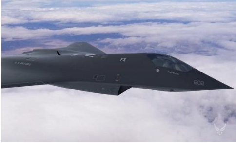
Ilustración 10: Laboratorio de Investigación de la USAF