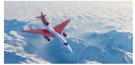
Ilustración 6: del artículo

Los aviones supersónicos han recibido un gran impulso de la Administración Federal de Aviación (FAA). Un nuevo fallo permitirá pruebas limitadas de aviones Mach 1-plus en tierra. Hasta ahora, líderes como Aerion, Boom y Spike se limitaban a realizar pruebas sobre el agua. El fallo de la FAA todavía prohíbe los vuelos supersónicos ilimitados sobre suelo estadounidense, pero abre un camino de exenciones para probar el avión experimental. La agencia estadounidense también espera impulsar a las autoridades de la aviación de otros países a moverse en una dirección similar, de modo que el vuelo supersónico transcontinental se convierta en una realidad, dentro de los próximos ocho años.