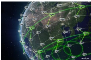
Ilustración 4: DARPA

El diseñador de la arquitectura de la Space Force (Fuerza Espacial) dice que esta debería ser más resiliente: una que pueda continuar brindando capacidades críticas basadas en el espacio, incluso si uno o más satélites están desactivados o destruidos. Para conseguir este objetivo, el Servicio necesitará una arquitectura más distribuida y maniobrable, con un mayor enfoque en los satélites que operan en órbita terrestre baja, dijo el coronel Russell "Russ" Teehan, director de cartera del Centro de Sistemas de Misiles y Espacio. Ese es un enfoque diferente para el ejército estadounidense, que tradicionalmente ha construido sus sistemas espaciales alrededor de un puñado de satélites grandes y muy costosos, los cuales operan en órbita geosincrónica.