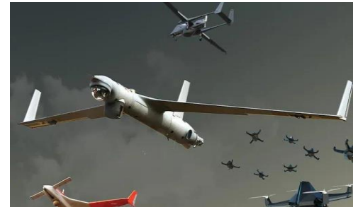
Ilustración 8: gráficos de Tanmoy Chakraborty

Por primera vez, India ha mostrado un sistema de drones de enjambre ofensivo que simula el derribo de una variedad de objetivos, desde tanques, campamentos terroristas, helipuertos y depósitos de combustible, en el desfile anual del Día del Ejército, en la capital. La demostración, que consistió en 75 drones que trabajan de forma autónoma para identificar y derribar objetivos con misiones Kamikaze, es un adelanto de la tecnología futura que está desarrollando el ejército en asociación con la industria privada.