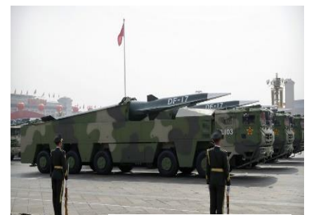
Ilustración 2: misiles hipersónicos DF-17 en Beijing 2019

Los misiles hipersónicos están sobrevalorados en términos de velocidad, y pueden ser detectados por sistemas de alerta temprana, según un informe de expertos en seguridad de Estados Unidos, el cual sugirió que su rendimiento es aproximadamente comparable al de los misiles balísticos convencionales. Las grandes potencias han estado explorando la capacidad de los misiles, que viajan mediante una trayectoria más baja y plana que los misiles balísticos intercontinentales, para reducir el tiempo que lleva trasladarse desde el lanzamiento hasta el impacto. Estos tienen la capacidad de cambiar de rumbo, una vez liberados de sus propulsores de cohetes.