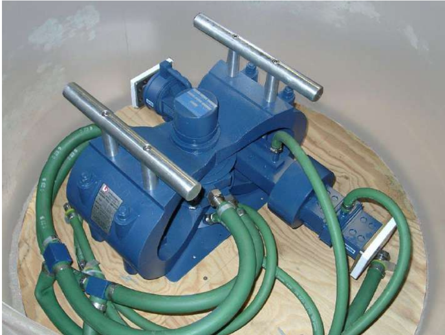
Figura 1: Amplificador de campo cruzado L – 4756A refrigerado por agua en su estuche de transporte

A veces se usan otros nombres para el amplificador de campo cruzado en la literatura como: