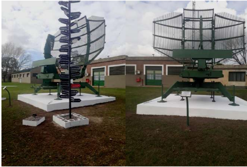
Vista del monumento inaugurado