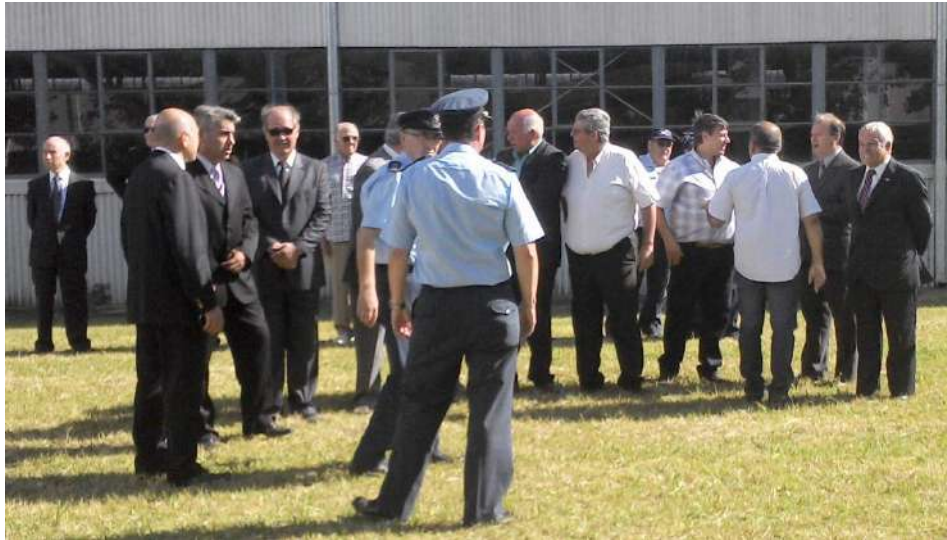
Integrantes del Escuadrón VYCA Malvinas, momentos previos a la ceremonia.